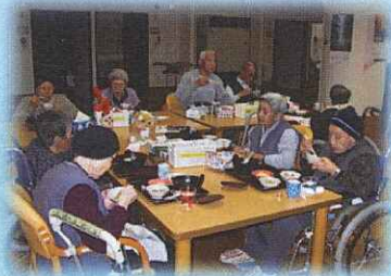
※ホールでの食事風景

食事提供等のサービスを受け、訪問介護等外部の在宅介護サービスをご利用いただきながら日常生活を送っていただける施設です。